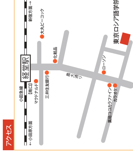
小田急線経堂駅南口より徒歩約5分